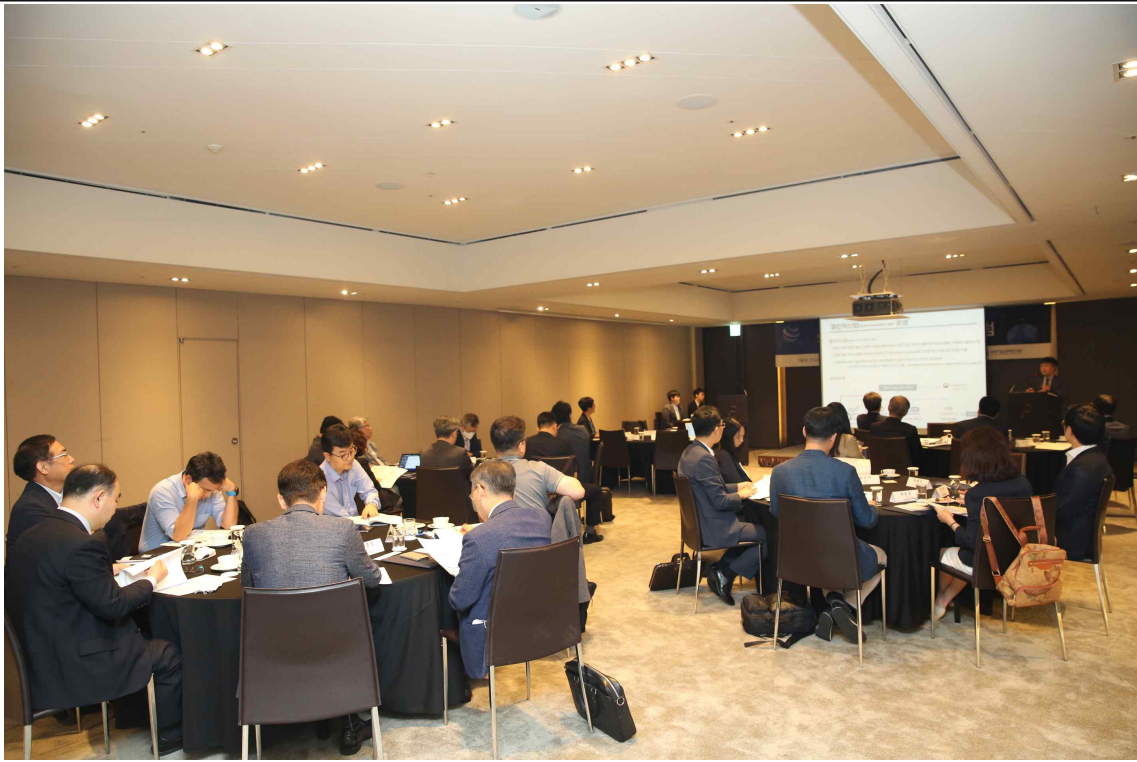
스마트생산 열린혁신 포럼 전경