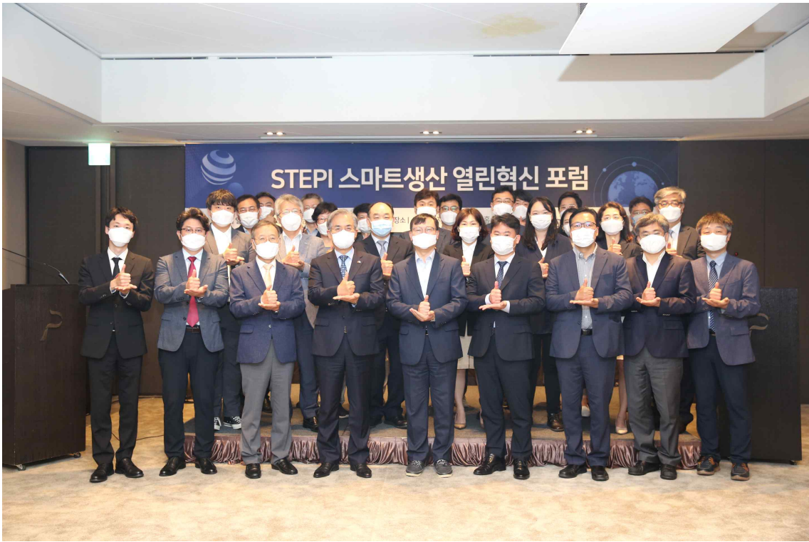
스마트생산 열린혁신 포럼 단체 사진